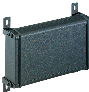
Abbildung: Optionale Wandhalterung