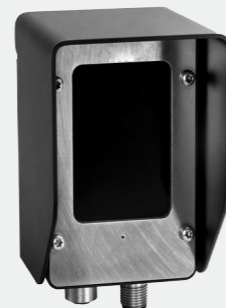
Abbildung Halierung zur Wand- oder Mastmontage