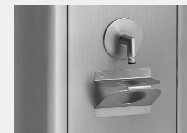
Abbildung 2 Schutzbügel gegen Verunreinigung durch Fehlbedienung