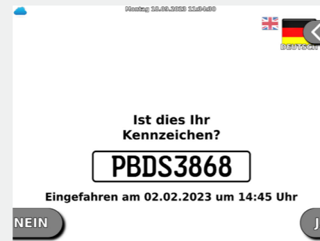
Abbildung 2 Bestätigung des Kennzeichens