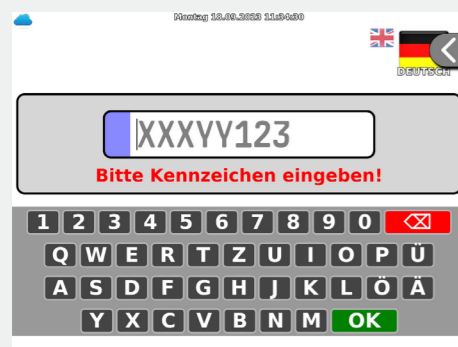
Abbildung 1 Kennzeicheneingabe am Kassenautomaten