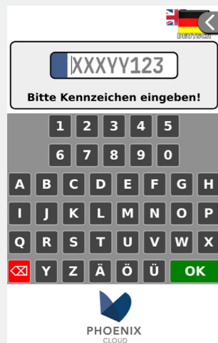
Abbildung 1 Screen PARKEN: Eingabe des Kennzeichens