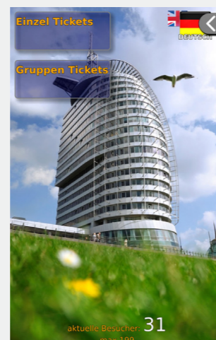
Abbildung 2 Screen ZUTRITT: Kauf eines Zutrittstickets